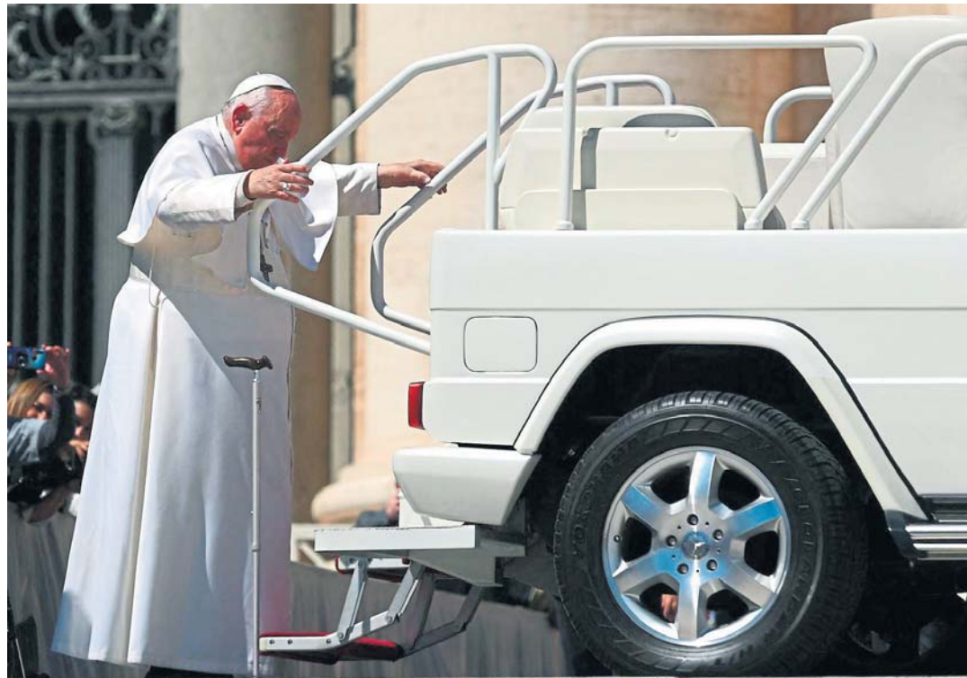
Francesc pujant ahir al papamòbil després de l'audiència setmanal a la plaça de Sant Pere

El Papa pren una decisió sense precedents per incloure les dones a l'Església