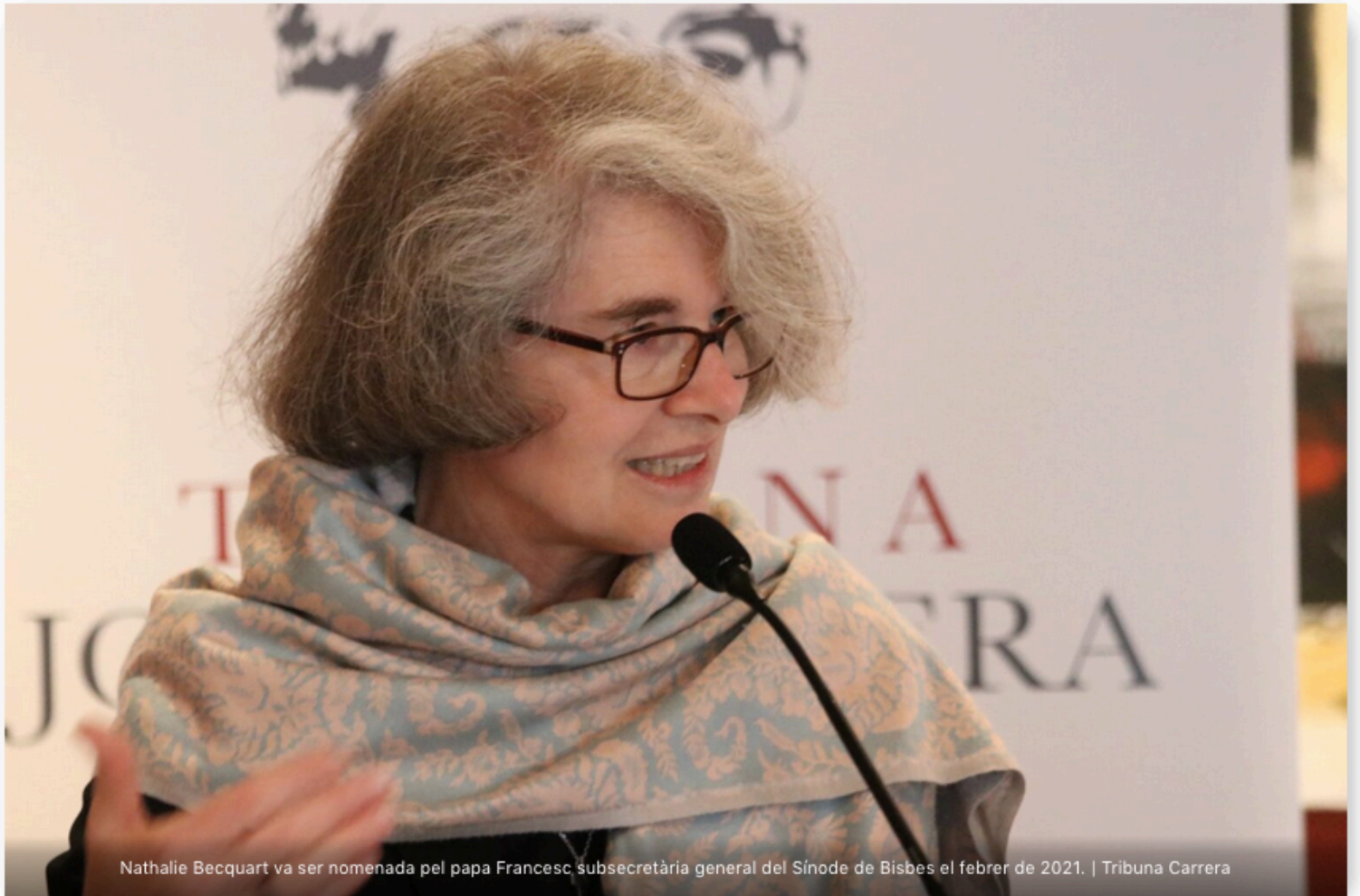
Nathalie Becquart va ser nomenada pel papa Francesc subsecretària general del Sínode de Bisbes el febrer de 2021.