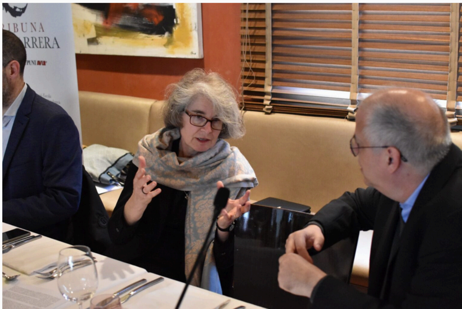
Becquart, amb Mn. Enric Termes. | Tribuna Carrera

En un món convuls marcat per nombroses guerres, impactes climàtics i diferents formes de desigualtat que obliguen a milions de persones a emigrar dels seus llocs d’origen, les dones, va subratllar Becquart, són les primeres víctimes. “Fer front —va dir— a la realitat de les dones a les societats marcades per una cultura patriarcal secular en què moltes són víctimes d’abusos de poder i d’abusos sexuals , en situa al cor del misteri pasqual que illumina la vida humana: el misteri de la vida més forta que la mort; el misteri d’una transformació que toca l’essència de la nostra identitat cristiana; el misteri del pas de la nit a la llum, de la creu a la resurrecció; el misteri d’una esperança més enllà del patiment”. “Pel sol fet que a totes les diòcesis del món s’estigui vivint l’experiència del camí sinodal, podem considerar l’experiència de les dones com un camí pasqual que posa de relleu els seu itinerari de resiliència ”.