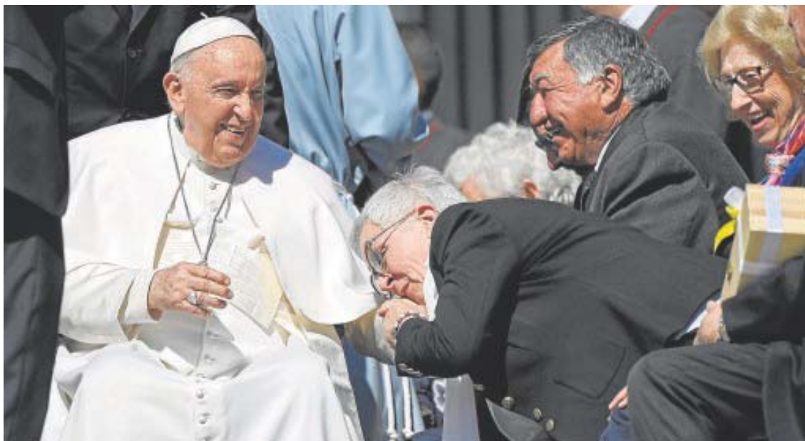
Un fiel besa la mano del Papa, ayer, durante su saludo en la plaza de San Pedro