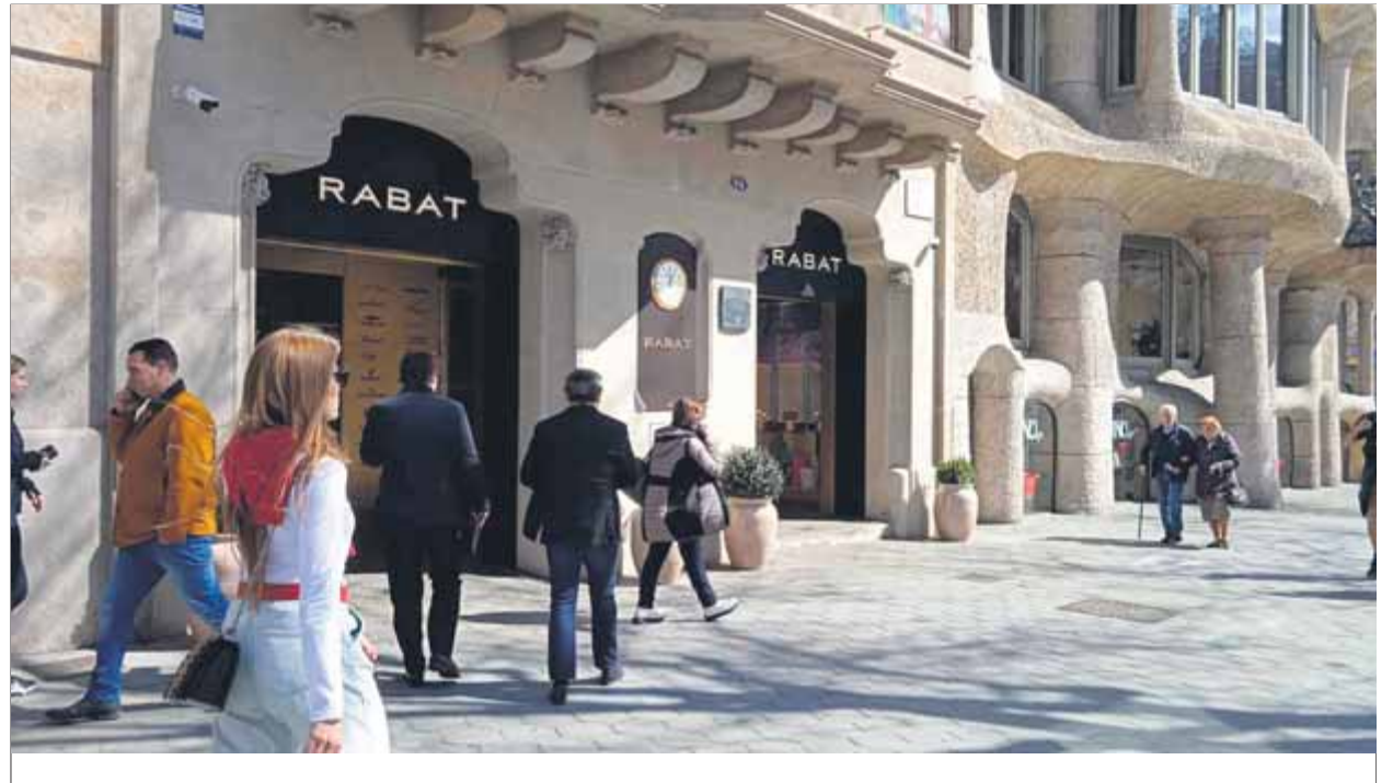
La joieria Rabat obrirà una tercera botiga al passeig de Gràcia aquest any 2023