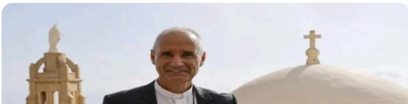
L'arquebisbe Jean Paul Vesco.

El passat diumenge 6 d'octubre el papa Francesc va anunciar per sorpresa la celebració d'un nou consistori pel 8 de desembre en el qual crearà 21 nous cardenals. Entre ells hi haurà el protagonista de la novena edició de la Tribuna Joan Carrera , l'arquebisbe d'Alger Jean-Paul Vesco, que en la seva primera entrevista després de saber que rebrà el birret cardenalici s'ha mostrat sorprès.