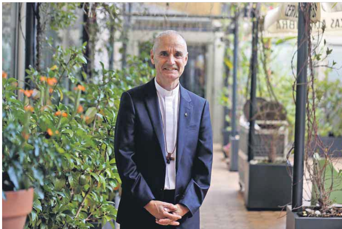
El nou cardenal Jean-Paul Vesco, al jardí del restaurant Pomarada de Barcelona, on va participar a la Tribuna Joan Carrera

Jean-Paul Vesco. Arquebisbe d'Algèria. El papa l'acaba de fer cardenal