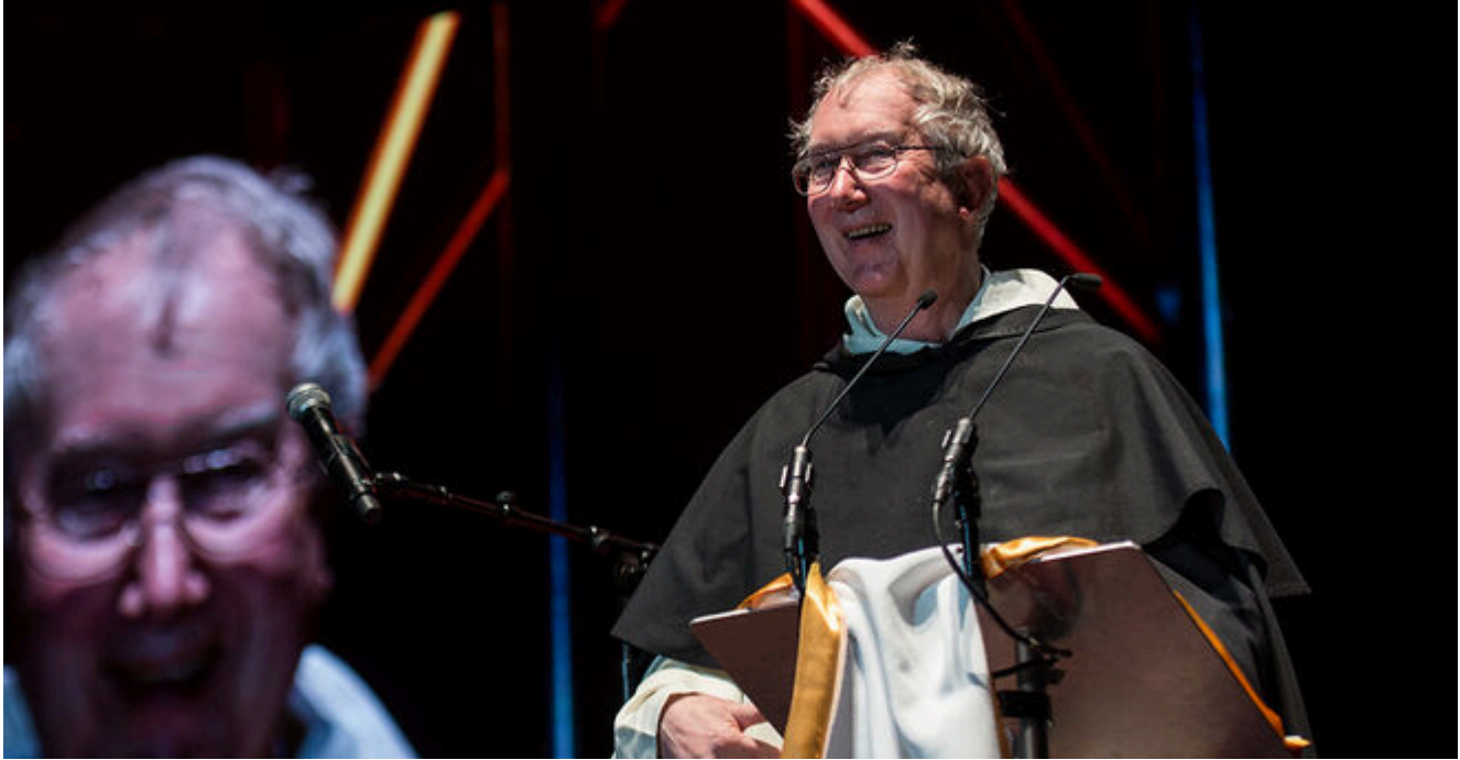
El dominico Radcliffe, nuevo cardenal

Vesco ha sido un faro de diálogo interreligioso y compromiso social en Argelia, un país predominantemente musulmán, donde su labor pastoral ha sido fundamental para promover la convivencia pacífica entre diferentes comunidades