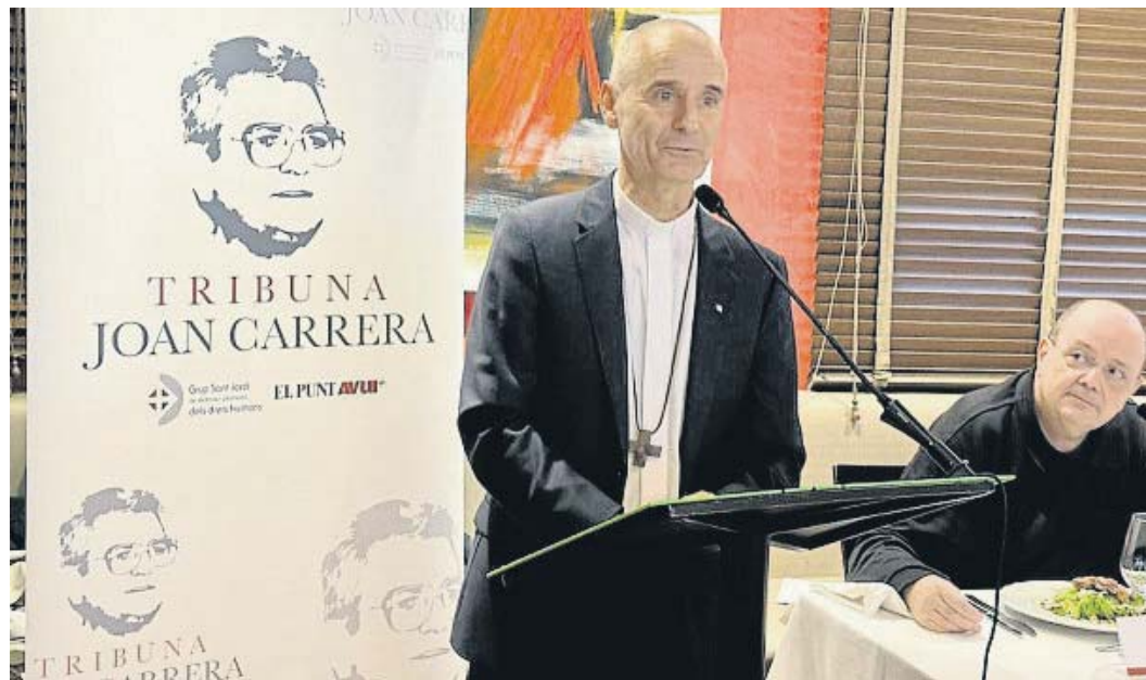
TRIBUNA JOAN CARRERA