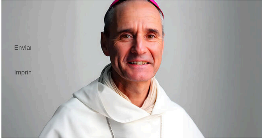
Jean-Paul Vesco, arzobispo de Argel