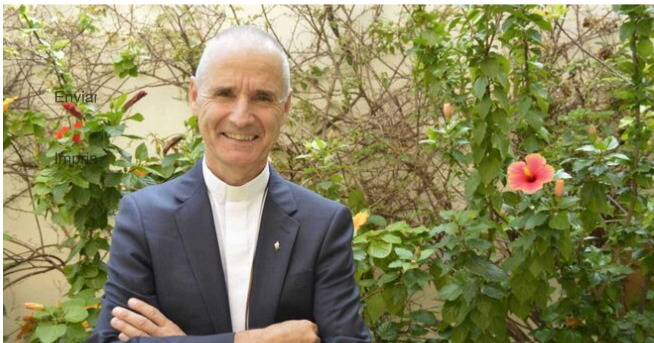
Jean Paul Vesco, hoy, en Barcelona Flama

"Con mi nombramiento cardenalicio, creo que el Papa ha querido tener un reconocimiento hacia la Iglesia en Argelia por su compromiso por mantener un diálogo fraterno con el islam"