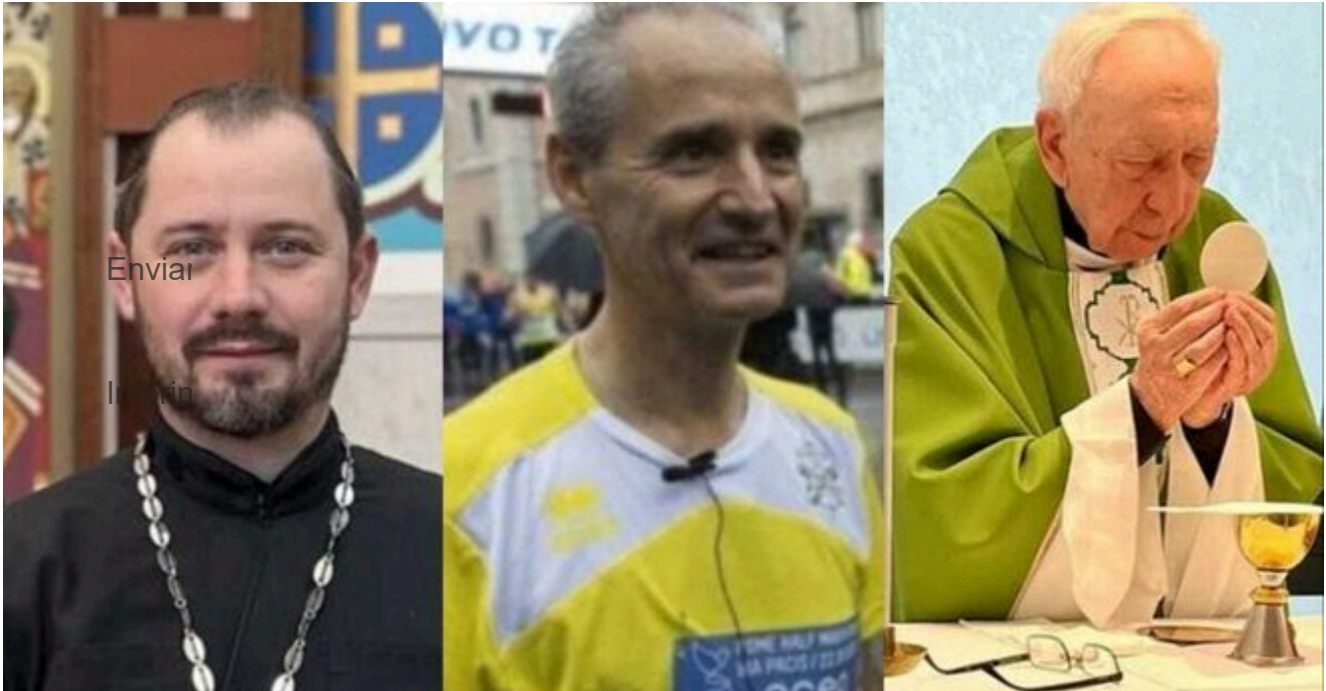
Mons. Mykola Bychok, Jean-Paul Vesco y Angelo Acerbi

El más longevo, el más joven, cinco de América Latina y prelados de las regiones más remotas del planeta figuran en la nueva lista del Papa Francisco para ampliar el colegio cardenalicio