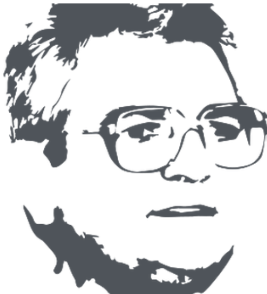
Tribuna Joan Carrera

La Tribuna Joan Carrera es una iniciativa conjunta del Grupo Sant Jordi, del diario El Punt Avui y de otras 24 entidades e instituciones que se adhieren, y tiene como finalidad "analizar la situación actual del cristianismo en Europa y en el mundo, difundir las experiencias de diálogo, comunicación y participación social y, en definitiva, potenciar la presencia del hecho religioso en la sociedad catalana".