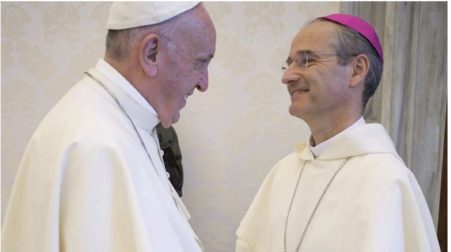
Jean-Paul Vesco, amb el papa Francesc.

L'arquebisbe també subratlla que aquesta nominació no només és un honor personal, sinó també un reconeixement per a l'Església d'Algèria. "Estic content per la nostra Església perquè crec que aquesta elecció la reforçarà" , admet Vesco, que dedica aquest honor al seu predecessor, Henri Tessier. "Va ser un home de gran personalitat que no va ser elevat a cardenal, tot i el seu gran servei a la diòcesi" , resumeix el bisbe, advocat i missioner francès.